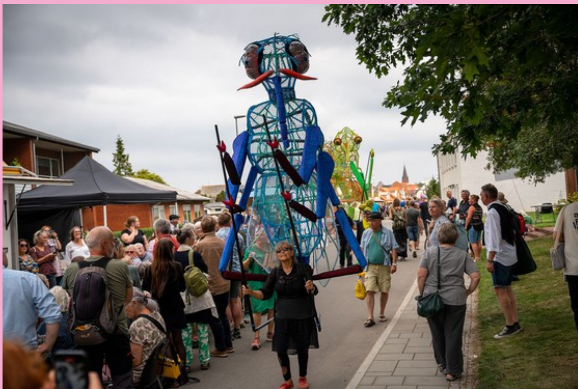
Kulturmøde Mors 2022.

Direkte link til talentnettets arrangement i Kulturmødets program